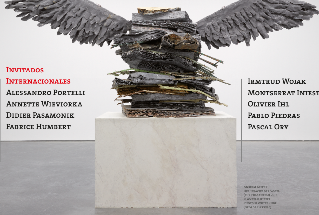
ANSELM KIEFER DIE SPRACHE DER VÖGEL (FOR FULCANELLA) 2013 © ANSELM KIEFER