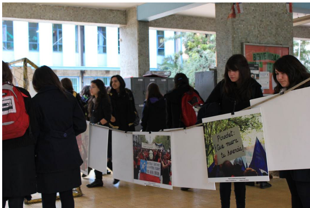
Exposición en Liceo 1. Junio 2012.