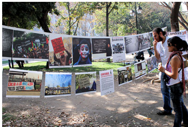
Imágenes de fotografías con diversos montajes.