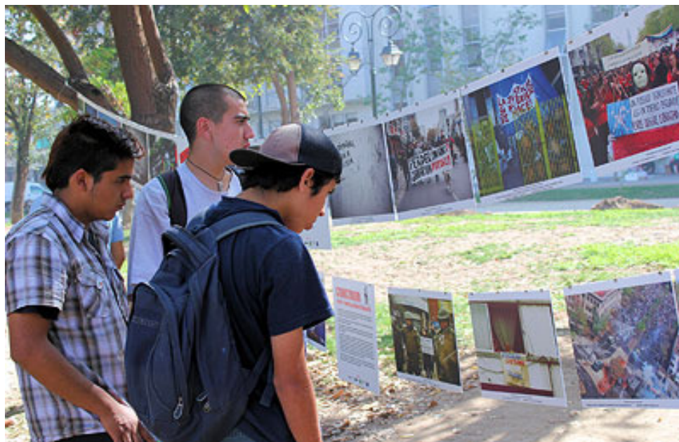
Exposición en Parque Almagro, en marco de manifestación estudiantil .21 de abril 2012.