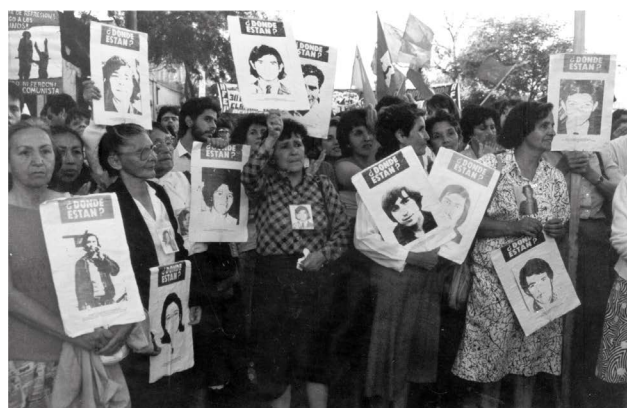
Manifestación de Agrupación de Familiares de Detenidos Desaparecidos

Es importante comprender que escribir las historias de vida de las 98 personas detenidas y ejecutadas de Londres 38 tiene una significación en sí mismo, por la relevancia de establecer una memoria histórica que ponga en primer lugar a las personas en sus identidades y subjetividades, dejando atrás la imagen estática del “¿Dónde Están?” que tanto tiempo nos ha acompañado. Esto no significa que dejemos de exigir que nos digan ¿Dónde Están? pero esa imagen comenzará a moverse, a adquirir color, otras imágenes de otros momentos aparecerán, permitiendo que la fotografía salga de su marco en el que fue encajado durante tantas décadas.