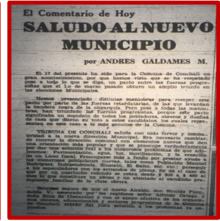
Recorte de prensa con texto de Andrés Galdámez